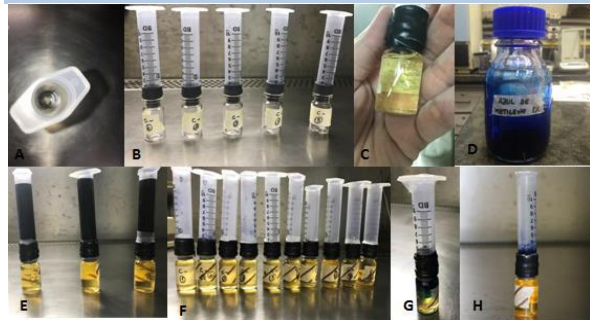
Figura 1. Etapas da montagem e análise das amostras no aparato. A- Vista superior do aparato; B- Controle negativo; C- Detalhe do aparato, com o ápice dental imerso no meio de cultura estéril; D- Frasco de azul de metileno 1%; E- Aparato preparado para teste; F- Após 4 dias, remoção do azul de metileno 1% de ambos os grupos controle (positivo e negativo); G- Aparato com infiltração; H- Aparato sem infiltração.

Para o acompanhamento da contaminação microbiana foi realizada a desobturação seriada do canal radicular, coletando individualmente a guta-percha correspondente a cada terço radicular. Esta foi introduzida em meio de cultura e posteriormente plaqueada e incubada para permitir a contagem das unidades formadoras de colônia (UFC/mL).