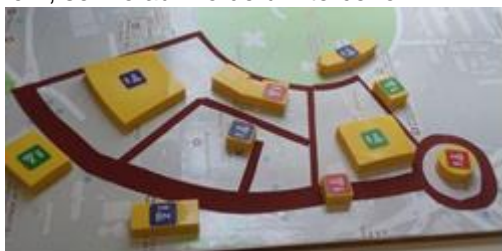
Figura 1. Maquete do Mapa Tátil Sonoro.

Com este intuito foi desenvolvido, através de um projeto Fapesp, o Mapa Tátil Sonoro (MTS), da figura, 1, que se trata de uma maquete da Unicamp, onde a pessoa com deficiência visual pode tatear e descobrir, através de um smartphone, quais são os prédios que tateia. Dando sequência, surgiu a necessidade de auxiliar uma pessoa com deficiência visual a chegar até um MTS, porém, sem o auxílio de um terceiro.