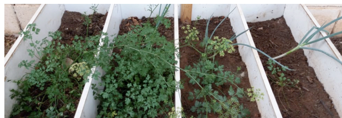
Figura 2. Horta 2x2 adubada com: biofertilizante da composteira (à esquerda) e adubo químico (à direita).