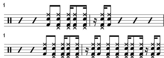
Figura 2. Exemplo do conceito "efeitos especiais", presente no improviso de Jeff Hamilton da obra Well You Needn't .