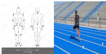
Figura 1. Marcadores Anatômicos. (a) Marcadores anatômicos acoplados ao atleta durante a trajetória dos 100m; (b) modelo de representação do corpo humano com os marcadores anatômicos adotados; figura adaptada, Livre de direitos autorais. Fonte: depositphotos [2].

Metodologia: Um Atleta de nível nacional em pista oficial da modalidade atletismo. A aquisição de imagens consistiu em registrar o andar, trotar e o sprint do atleta durante toda a trajetória de 100m. Para o enquadramento de toda a pista outdoor de atletismo foram utilizadas doze câmeras digitais, fixadas em tripés, sendo oito câmeras da marca JDC (modelo GZ-HD620BU) e quatro câmeras da marca Casio (modelo EXFH25), e a frequência de amostragem foi de 60 Hz; O Software utilizado foi o MATLAB e Dvideo. As medidas antropométricas como massa corporal, estatura, comprimento e diâmetro dos segmentos corporais foram aferidas.