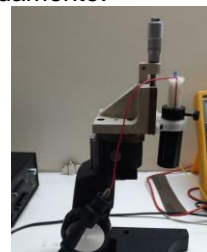
Figura 2. Montagem óptica composta por um LED e uma lente plano-convergente.

Na discussão da montagem com colaboradores da biologia, verificamos a necessidade de irradiar áreas relativamente grandes de uma vez, pois as células podem se mover na placa de Petri ao longo dos experimentos. Exploramos então montagens ópticas que consistiam na associação do LED com lentes, objetiva e plano-convergente. Para isso, utilizamos um manipulador micrométrico de um eixo e fabricamos peças com uma impressora 3D com o objetivo de melhorar e uniformizar a distribuição espacial do feixe, além de otimizar o tempo total de irradiação celular. A otimização desta montagem encontra-se em andamento.