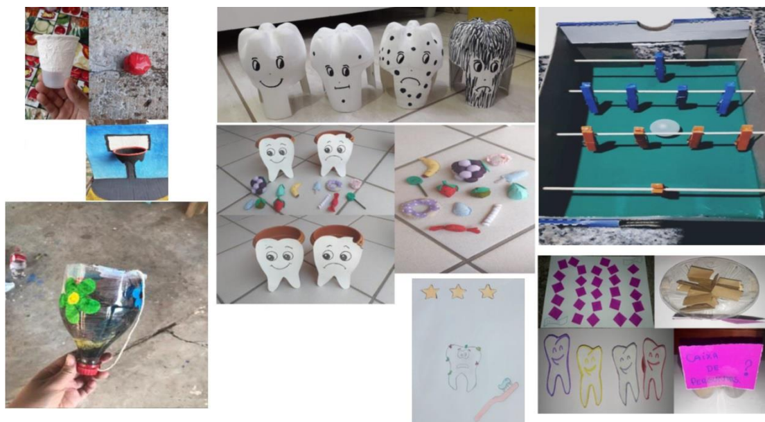
Figura 2: Brinquedos educativos desenvolvidos durante as atividades pelos alunos do PIBIC-EM

Nesse sentido, os brinquedos e jogos foram criados e estão apresentados na Figura 2. Cada um deles tem uma proposta educativa diversificada: relaxar e divertir as crianças e orientar e reforçar informações a respeito de saúde bucal.