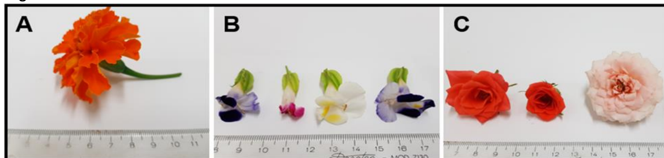
Figura 1. Flores comestíveis utilizadas no trabalho.

Para a realização desse trabalho, a empresa Calusne Farms - Campinas/SP doou flores comestíveis das espécies Tagetes patula L. (Figura 1 A), Viola tricolor (Figura 1B) e Rosa chinensis (Figura 1C), que foram recebidas higienizadas e prontas para serem utilizadas.