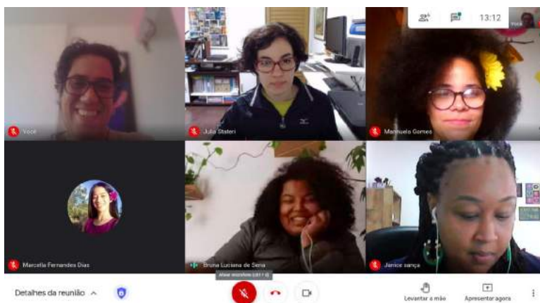
Imagem 3: Desenvolvimento dos jogos