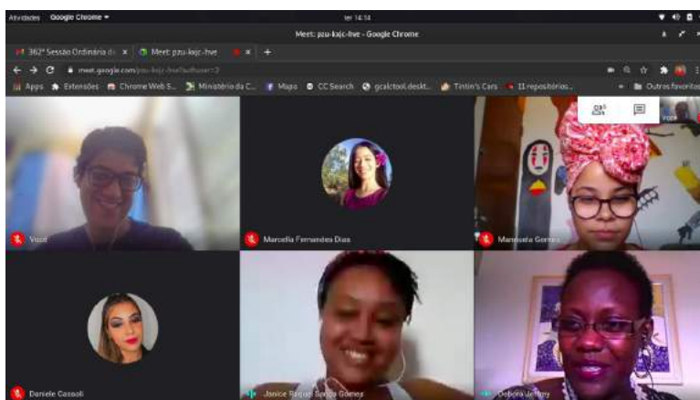
Imagem 5: Apuração do projeto e introdução ao tema afrofuturismo