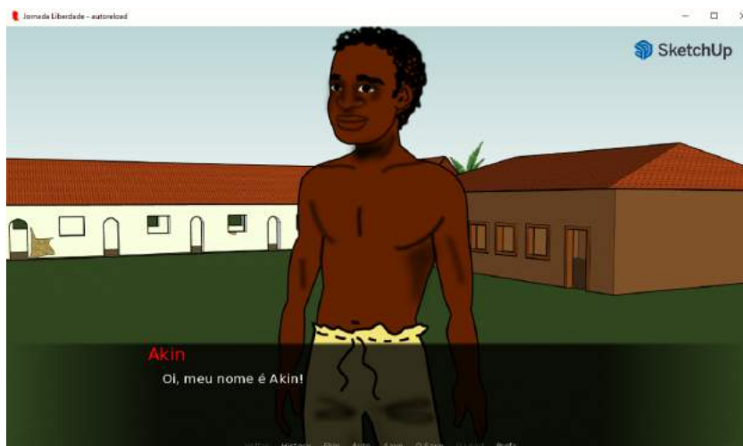
Imagem 1: Akin se apresentando

Em outro momento, a escrita do enredo da história foi feita pelo site inklewriter, onde foi possível desenvolver em um modelo de história interativa. Após isso foram baixados os aplicativos Renpy e Atom, um para abrir o jogo e o outro para programar, respectivamente. De forma que usamos em paralelo os dois aplicativos até que o resultado ficasse como o planejado e compartilhado.