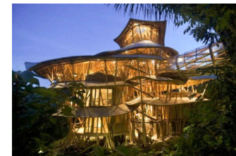
Fig. 9 – Casa de Bambu