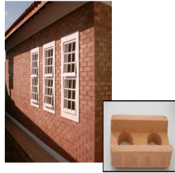
Fig. 4 – Construção com solo cimento