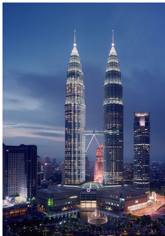
Fig. 7 – Petronas Towers