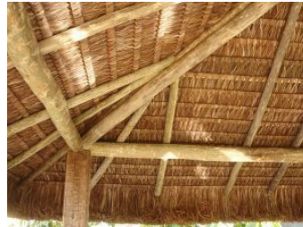
Fig. 5 – Quiosque de piaçava