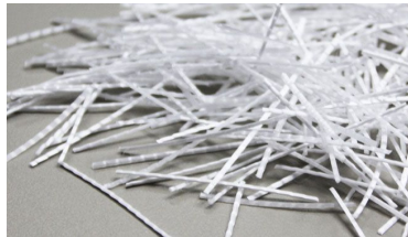
Fig. 6 – Fibras de polipropileno (fonte: https://texdelta.com/blog/aplicaciones-y-ventajas-del-uso-de-fibras-de-polipropileno/ )