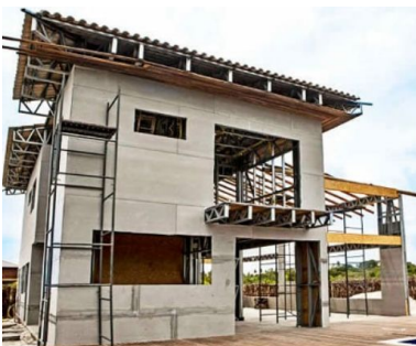
Fig. 3 – Casa em steel frame