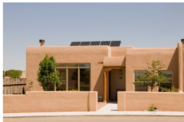
Fig. 1 – Casa de terra crua