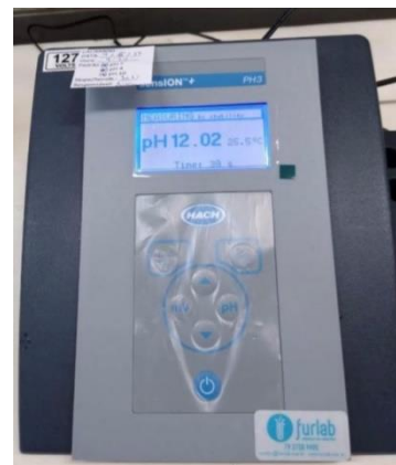
Figura 1. Medição do pH do hidróxido de sódio, através do pHmetro.

pH - A escala de potencial hidrogeniônico determina a acidez ou alcalinidade de uma solução. A determinação desse parâmetro pode indicar a toxicidade da amostra e poluição atmosférica na área de coleta, por exemplo. A faixa adequada de pH para a água de consumo, de acordo com a Portaria de Consolidação Nº 888 do Ministério da Saúde, é entre 6,0 e 9,0. O pH é determinado através de métodos eletrométricos (eletrodo de pH ou pHmetro – Figura 1) ou por métodos comparativos (papel indicador universal ou indicadores colorimétricos).