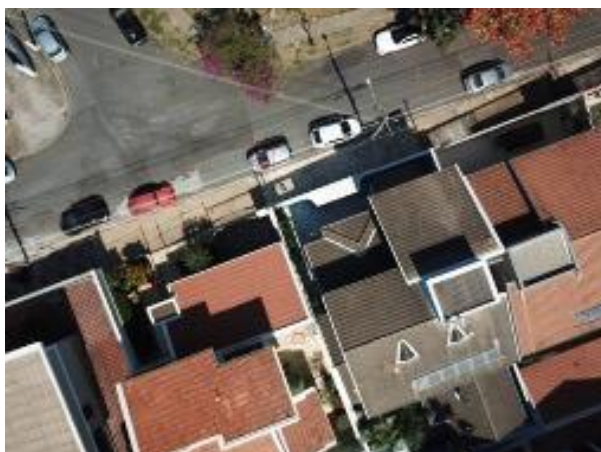
Figura 5 – Análise do arquivo DJI_0108.jpg com CT.