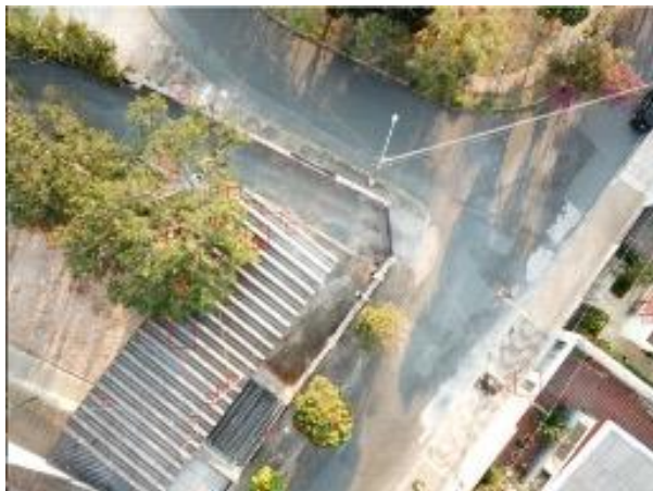
Figura 6 - Análise do arquivo DJI_0418.JPG com CT.

Com os resultados obtidos do projeto, foi possível analisar a eficácia da inteligência artificial que desenvolvemos através do OpenCV em Python, além de descobrir possíveis variáveis que afetam a contagem de carros e resultado da IA como, por exemplo: horário, resolução das fotos capturadas e presença de árvores. Entretanto, apesar dessas variáveis,