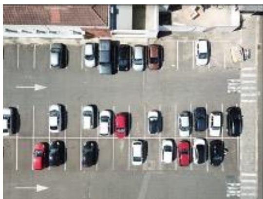
Figura 1. Arquivo carrosDia3.jpg capturada durante o voo teste, o primeiro feito, em um estacionamento.

a quantidade de veículos identificados. Após seguidas execuções, foi notado que a quantidade de veículos não identificados seguia uma margem de erro de 10% para mais ou para menos em relação à quantidade real.