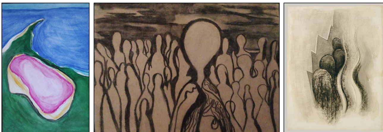
Figura 5. A. s/título 1 , 2022. Rafaelly Nunes Siqueira da Silva. Aquarela sobre papel. 21,0x29,7cm B. s/título 2 , 2022. Rafaelly Nunes Siqueira da Silva. Carvão sobre papel Kraft. 42,0x29,7cm C. Desenho XIII , 1915. Georgia O'Keeffe. Carvão sobre papel. Fonte: https://pt.wikipedia.org/wiki/Georgia_O%27Keeffe

Rafaelly Nunes Siqueira da Silva, encaminhou-se pelas pesquisa do onírico e concebeu uma série de imagens de inspiração surrealistas. Há um interesse pela aprofundamento da subjetividade psíquica, pela forma mais livre, orgânica e pelos contraste de cor e preto e branco (Figura 5).