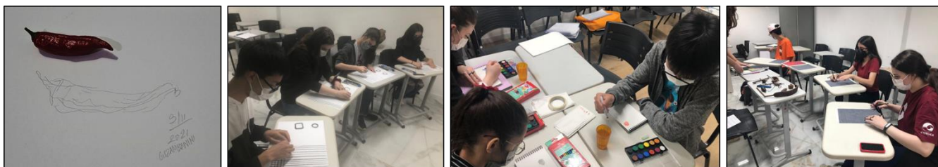
Figura 1. Oficina online de desenho cego, 2021. Oficina de carvão, 2022. Oficina de aquarela, 2022. Oficina de desenho de observação com folha de carbono, 2022.

Trata-se de uma pesquisa de abordagem qualitativa e de caráter auto investigativo, cuja meta principal foi a reflexão sobre a prática e a linguagem poética pessoal do desenho. Os procedimentos metodológicos de pesquisa incluíram: reuniões semanais coletivas ou individuais; prática constante do desenho e de exercícios de estímulo de criatividade; pesquisa de materiais e suportes; leituras de textos sobre a linguagem gráfica e da arte em geral; estudo de três artistas que de alguma forma apresentam afinidades com o desenho. Importante esclarecer que durante os meses de setembro a fevereiro, encontrávamo-nos em formato remoto devido à pandemia. Durante este período a interação se deu através de reuniões pelo Google Meet , Google Classroom e WhatsApp , fato que implicou na necessidade dos estudantes se organizarem com uma maior autonomia de trabalho e das orientadoras encontrarem novas formas de conduzir as propostas práticas e de analisar a criação gráfica, uma vez que a reprodução do original dificulta este processo, dada a materialidade do desenho. A retomada das atividades presenciais em 07 de março de 2022, pode-se dizer, foi um fato de suma importância para o desenrolar da pesquisa (Figura 1).