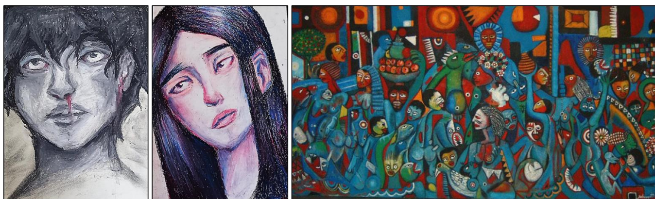
Figura 2. A. Defatigatus , 2022. Giovana Zambanini. Pastel sobre papel. 21,5cm x 27,9 cm. B. Até quando? , 2022. Giovana Zambanini. Pastel sobre papel. 21,0 cm x 29,7cm. C. Juventude e paz , 1997. Malangatana. Óleo sobre tela, 200 x 400 cm. Fonte: http://www.unesco.org/artcollection/NavigationAction.do?idOeuvre=2999

Giovana Mendonça Zambanini escolheu trabalhar com artistas fora do eixo europeu e norte-americano. Sua produção de retratos segue uma linha expressinista, com estilizações geometrizes da figura humana. Além da expressividade das personagens, há um interesse pela sobreposição de camadas de cor e texturas (Figura 2).