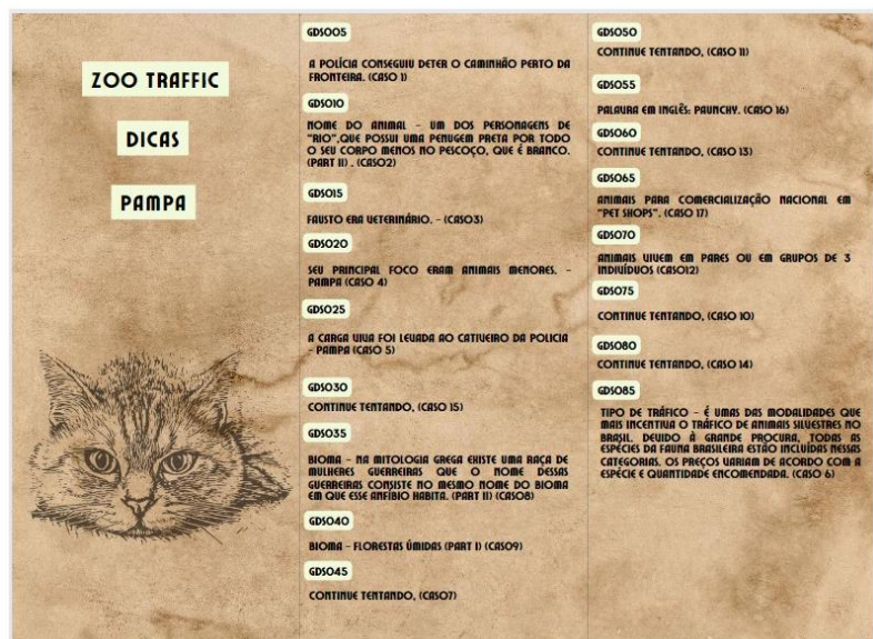
Figura 3. Imagem do panfleto com dicas para solucionar os casos.

O jogo foi testado e os possíveis erros e detalhes que precisam ser arrumados serão feitos antes da impressão final do jogo, prevista para agosto.