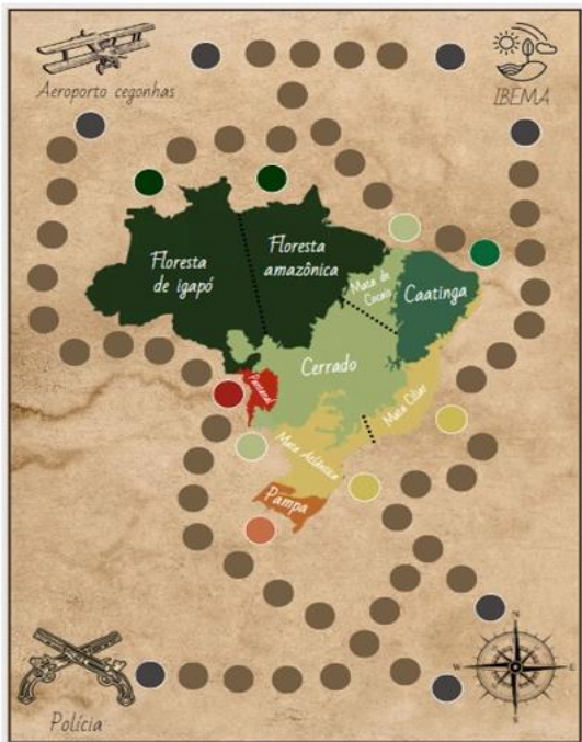
Figura 2. Imagem do tabuleiro desenvolvido para o jogo.

O objetivo foi produzir um jogo dinâmico e didático, onde os jogadores obtenham informações além de se divertirem. Então as integrantes optaram por fazer um jogo envolvendo investigação e mistério, e o tráfico animal. A ideia central é que o jogador seja como um detetive ou um agente ambiental na resolução de casos de tráfico.