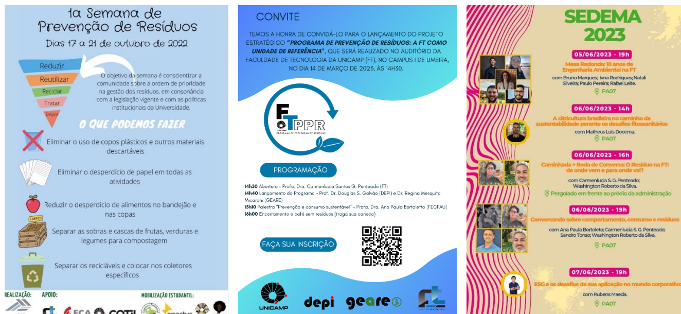
Figura 01: Folders de divulgação de alguns eventos realizados no Campus I da Unicamp em Limeira relacionados a Sustentabilidade.