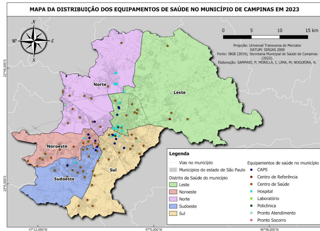
Fig 2: Mapa da distribuição dos equipamentos de saúde no município de Campinas em 2023