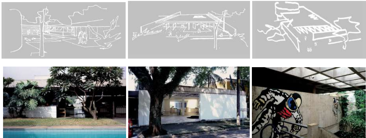
Imagens 1, 2, 3, 4, 5 e 6: Croquis do arquiteto Decio Tozzi e fotos das residências estudadas. Coluna 1: Residência Elio Tozzi; Coluna 2 - Residência Claudio Tozzi; Coluna 3: Residência Teófilo Orth.

Com os levantamentos concluídos, realizou-se o redesenho digital das residências (tanto em 2D como em 3D), possibilitando a análise gráfica dos projetos e modelos, com cortes perspectivados. Logo, com tais passos finalizados, desenvolveu-se uma análise crítica acerca das obras que será apresentada posteriormente.