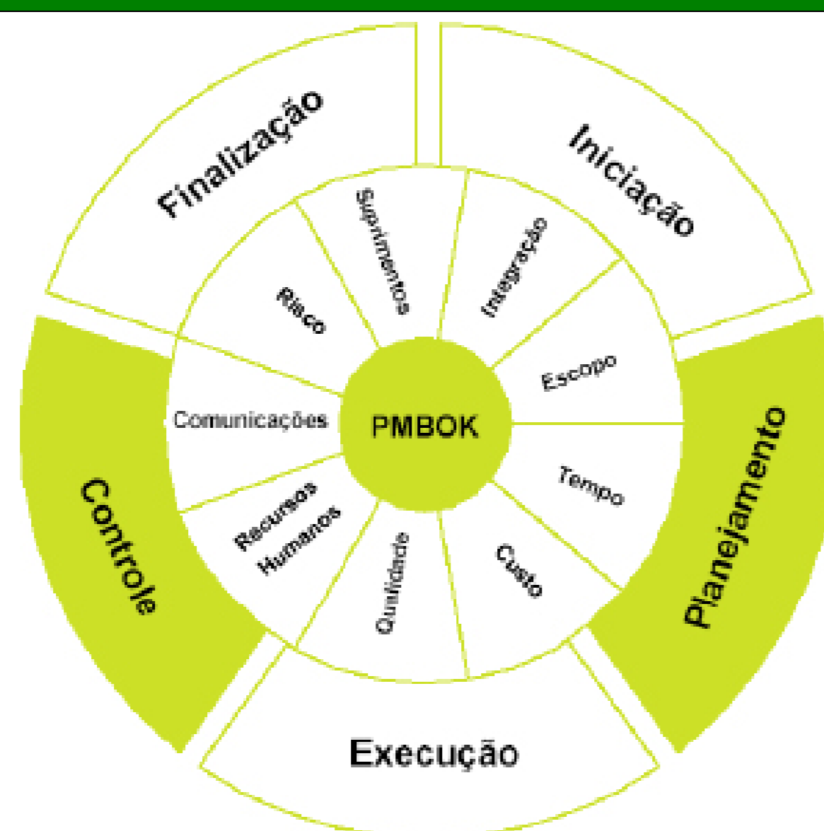
Figura 1 – Estrutura PMBOK adotada