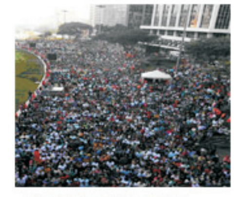
Reunião de fiéis da Igreja Internacional da Graça de Deus no Vale do Anhangabaú, São Paulo. Em 09/07/2007.