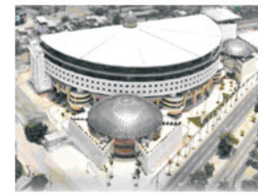
Imagens do Templo Maior da Igreja Universal do Reino de Deus. Situado no bairro de Del Castilho, Rio de Janeiro, possui capacidade para 15 mil pessoas sentadas em 45 mil m² de área construída