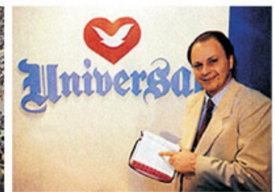
Edir Macedo, líder e fundador da Igreja Universal do Reino de Deus