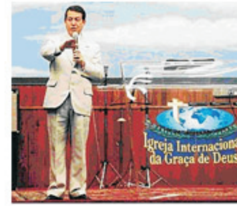
Missionário Romildo Ribeiro Soares, líder-fundador da Igreja Internacional da Graça de Deus e apresentador do programa "Show da Fé" – os programas de televisão vinculados a essa igreja chegam a 100 horas semanais no Brasil.

10 cultos neopentecostais – cerca de 30' cada – registrados audiovisualmente e transcritos de acordo com as normas adaptadas do Projeto NURC: 5 cultos extraídos do programa "O Santo Culto em seu lar", realizado pela Igreja Universal do Reino de Deus; 5 cultos extraídos do programa "Show da Fé", realizado pela Igreja Internacional da Graça de Deus.