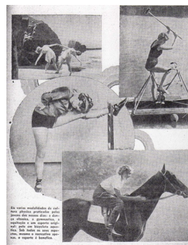
“Dansa Clássica e Esportes.” Julho, 1938.