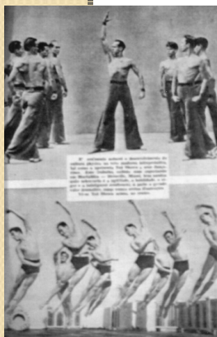
Revista Educação Physica, n. 15, fevereiro, 1938, p. 19

Conclusões: Reforça-se a necessidade de apropriarmos-nos da História como um conteúdo vivo e dinâmico, pois grande parte das próprias práticas corporais do presente é produto daquilo que se têm construído ao longo do tempo.