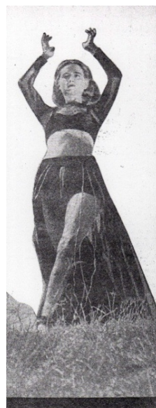
“Dansa Clássica.” Maio, 1941