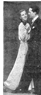
“Dansa Social”. Revista n. 38, janeiro de 1940, p. 18.

Introdução: A dança, compreendida como uma manifestação da Cultura Corporal e conteúdo pertinente à Educação Física, constitui-se num complexo espaço que reflete a teia de relações humanas e conflitos da realidade na qual se insere. Logo, pode ser entendida como linguagem social que tem muito a nos dizer. Este trabalho objetiva analisar e explorar as questões de gênero e os valores sócio-culturais e político-econômicos que perpassam e se mesclam à prática da dança sob a ótica da Educação Física no Brasil, entre os anos de 1937-1945, período em que o país era marcado por significativas transformações debaixo do governo Estado Novista.