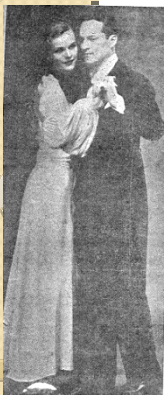
“Dansa Social”. Revista n. 38, janeiro de 1940, p. 19.

Palavras Chave: Dança - Educação Física - Estado Novo