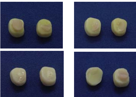
Figura 3 – Tipos de fratura