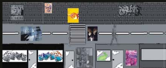
Criação: Ronye Pires

Rua, muro, vitrine. Elementos escolhidos do calçadão de Campinas para movimentar a divulgação científica no projeto Biotecnologias de Rua. Num primeiro movimento, o blog é pensado explorando esses três elementos colados às possibilidades de problematizar as conexões entre biotecnologias, arte, movimentos sociais e mercado.