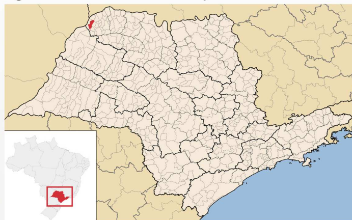
Figura 1 – Santa Fé do Sul - localização