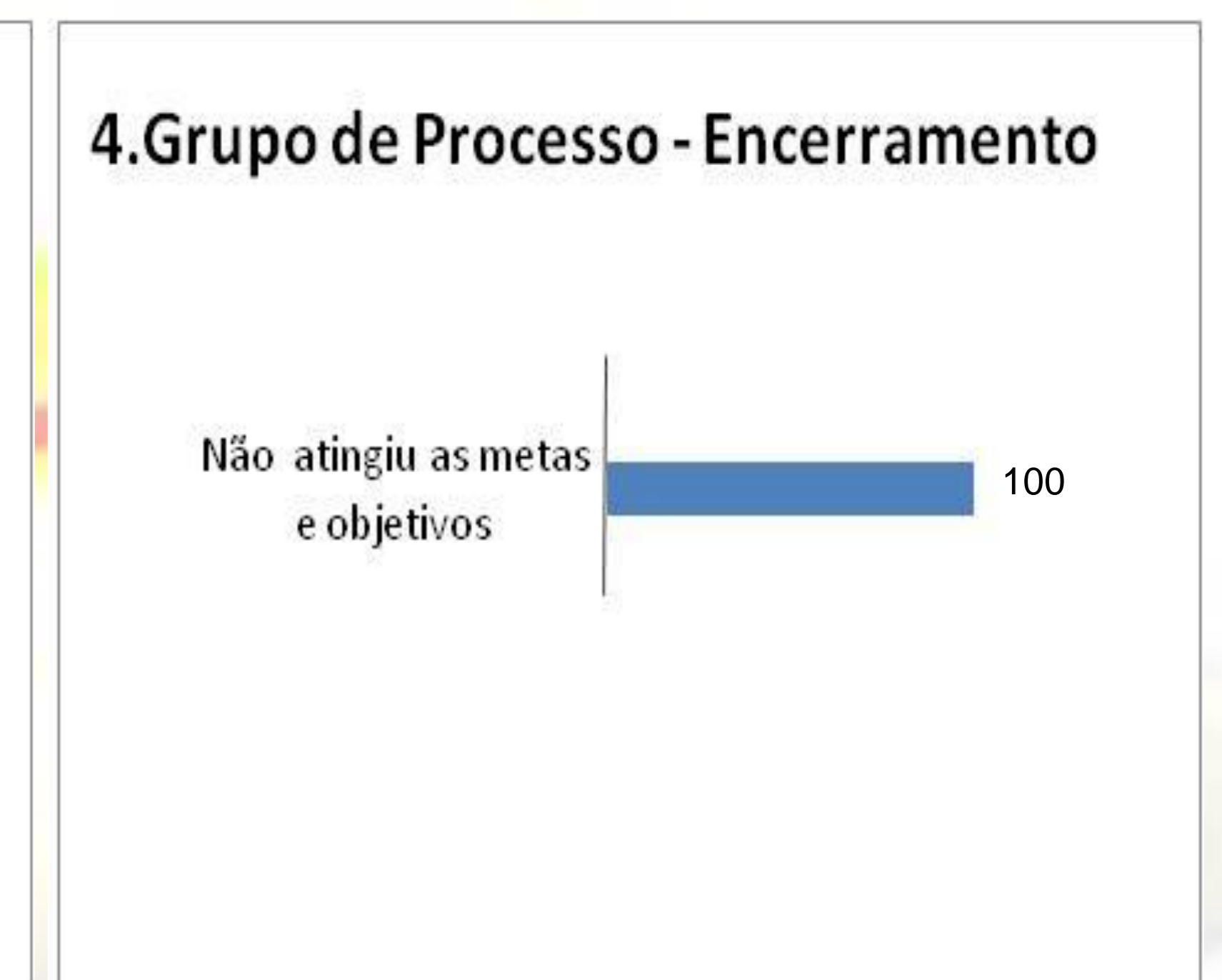
Gráfico 4: Grupo de Processos 4

Neste projeto podem-se identificar como fatores críticos de sucesso e falhas do projeto os seguintes fatores, conforme a Tabela I: