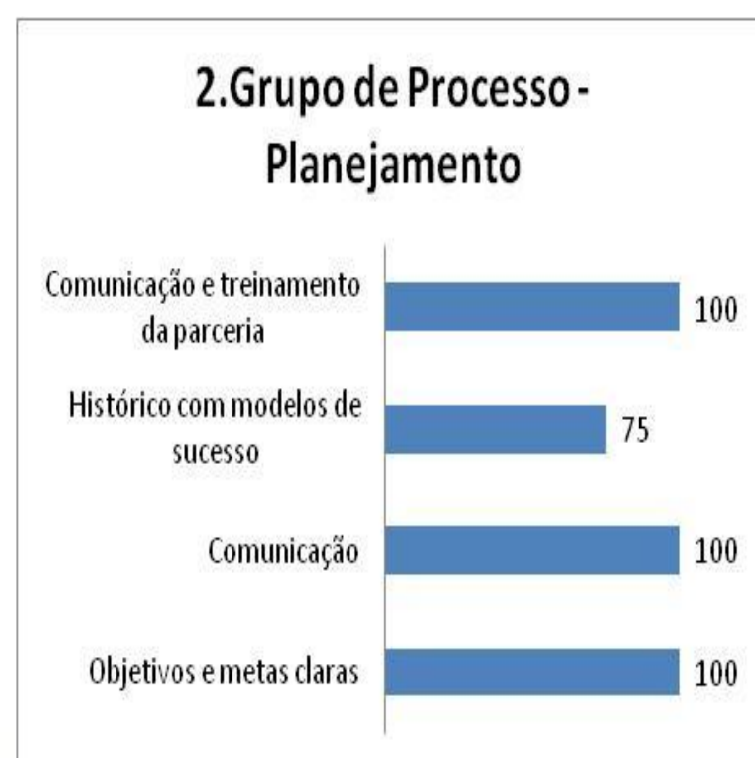
Gráfico 2: Grupo de Processos 2