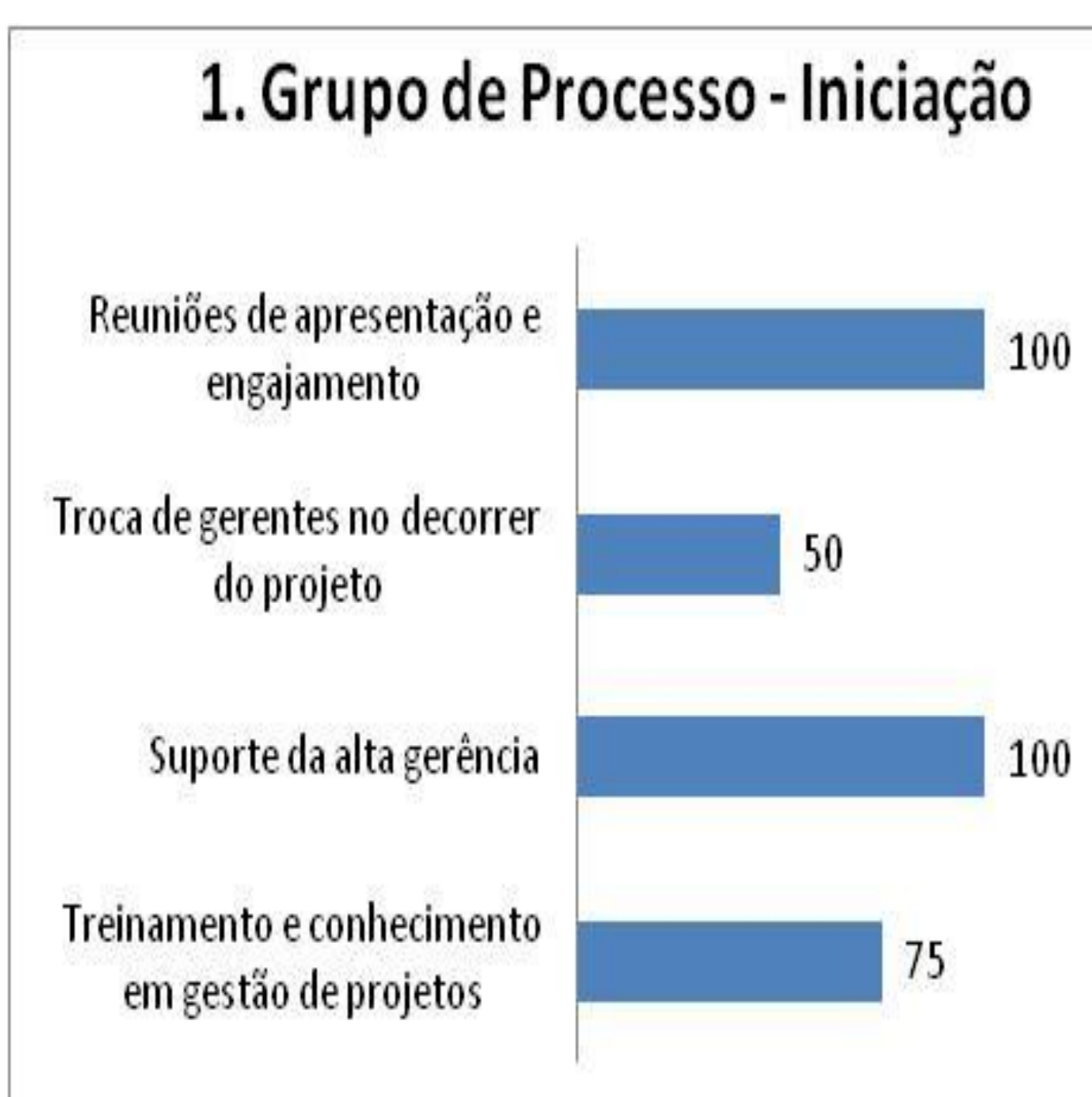
Gráfico 1: Grupo de Processos 1

A seguir é apresentada, em gráficos, as resposta dos entrevistados: