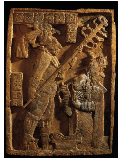
Dintel de Yaxchilán

THOMPSON, J. E. S. Grandeza y decadencia de los mayas . Mexico, D.F.: Fondo de Cult. Económica, 1984.