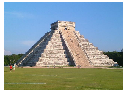
Pirâmide de Kukulcan em Chichén Itza