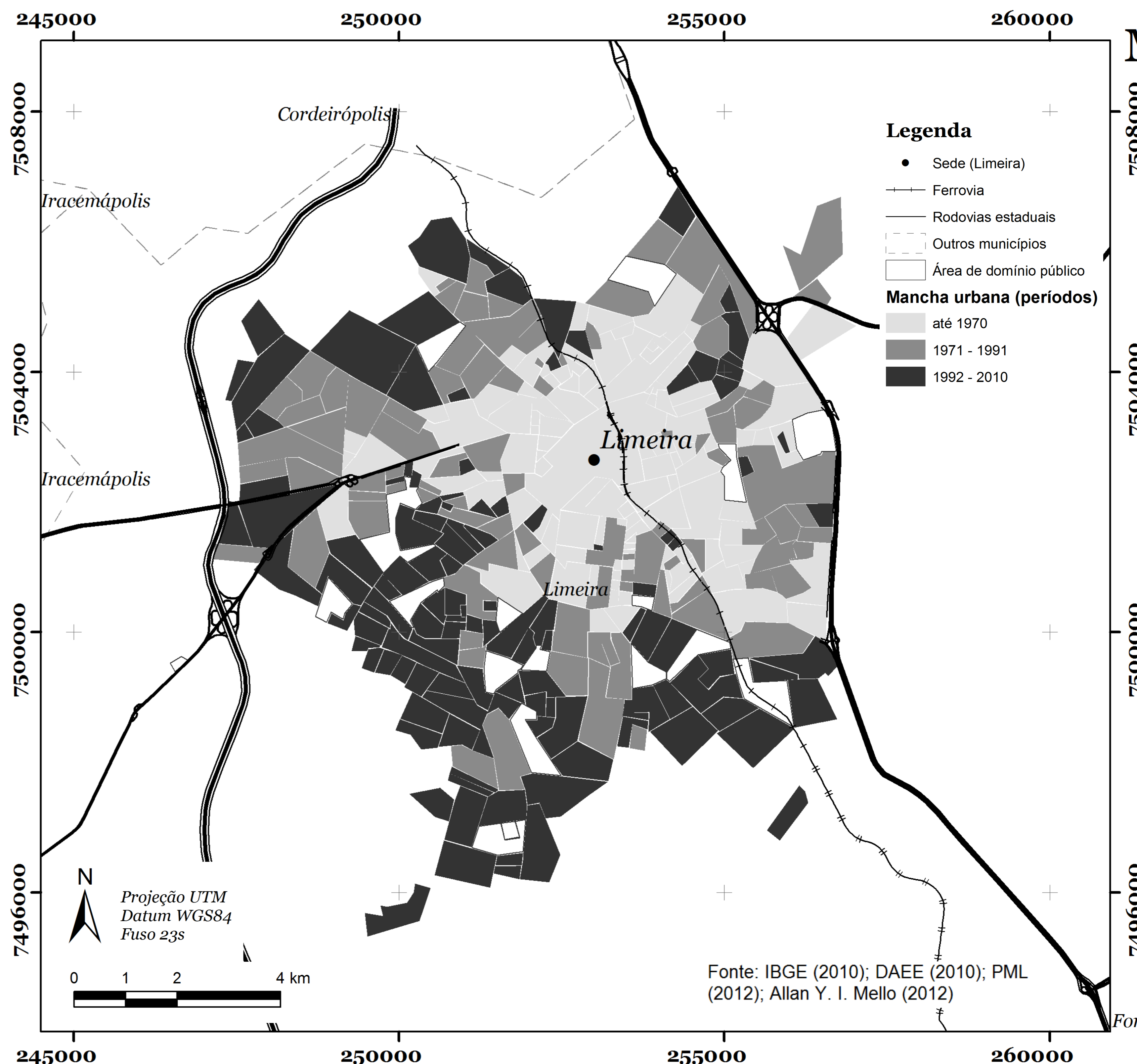
Figura 2. Expansão da mancha urbana no município de Limeira, baseado na delimitação de bairros por períodos – até 1970, 1971 - 1991, 1992 - 2010.

No mapa gerado, observa-se que a tendência da mancha urbana de crescimento é para a zona sul, região perto da Rodovia dos Bandeirantes SP-348, porém existe um aumento significativo no número de condomínios fechados e projetos aprovados para verticalização urbana, conforme o Plano Diretor da cidade. Na Figura 2, ao lado, verifica-se o processo de expansão urbana para a zona sul. A população cresceu numa taxa menor do que o crescimento da mancha urbana (Tabela 1), conforme vários fatores como, estradas, shopping centers, novas universidades, programas habitacionais governamentais, como Minha Casa Minha Vida do Governo Federal, programa destinado ao fomento da construção civil no país e novos loteamentos privados aprovados pela Secretária de Planejamento e Urbanismo.