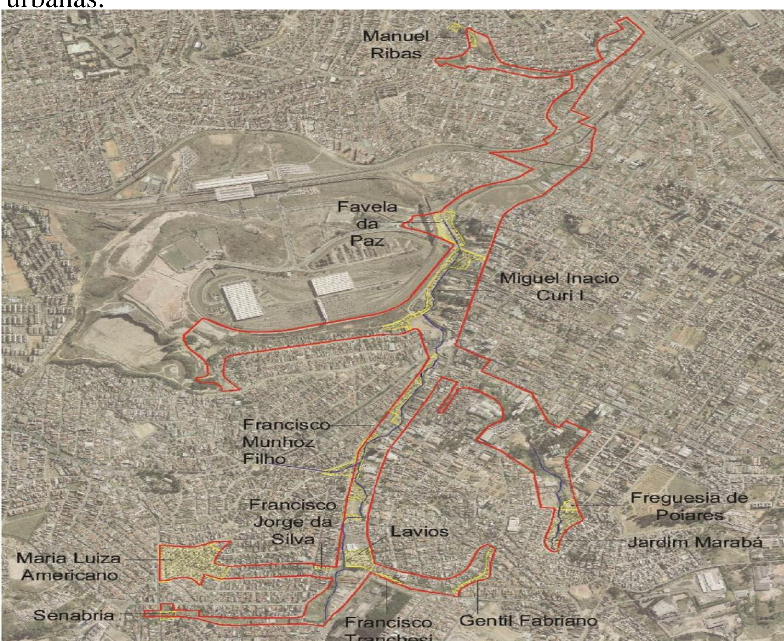
Figura 1 – Favelas a serem removidas por conta das intervenções urbanas.

Segundo o Projeto Urbanístico de Itaquera, a previsão é de que cerca de 2.394 famílias sejam removidas de seus atuais locais de moradia para implantação do parque linear do Córrego Rio Verde e do Polo Institucional de Itaquera.