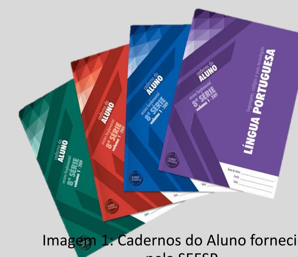
Imagem 1: Cadernos do Aluno fornecidos pela SEESP

O presente projeto de iniciação científica tem como enfoque uma discussão acerca do currículo prescrito pela Secretaria de Educação do Estado de São Paulo (SEE/SP), focalizando a área de Linguagens e como disciplinas Língua Portuguesa e Línguas Estrangeiras Modernas. As práticas curriculares e a identidades docentes são problematizadas, nessa investigação.